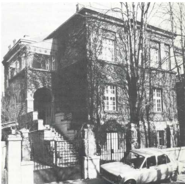
Ранкеова 11, 1926

Богатије обрађеним крилима композиције одговарао је, очигледно, скромнији везни елемент. Најзад, двојна зграда у Улици Гастона Гравијеа понавља неке елементе зграде у Ранкеовој бр. 12-14, симетричност волумена, низове слепих arkada, на је-дан мање упадљив, мање строг, пре-тежно декоративистички начин, што је све у складу са умањеним значајем улице.